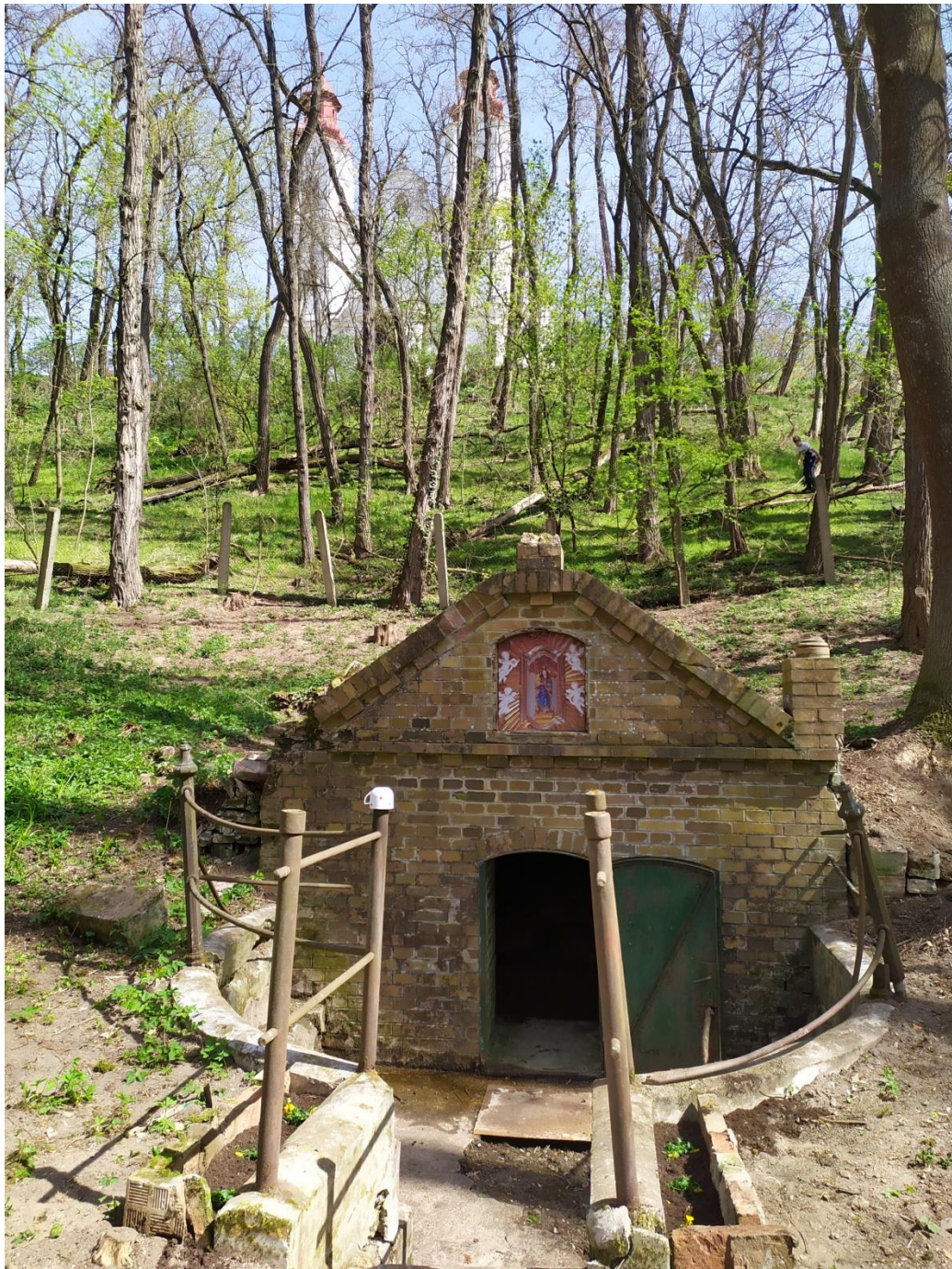
Lechovice - původní poutní studánka pod kostelem